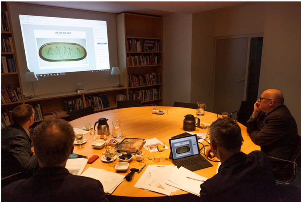
Impressie van de bijeenkomst van Witjes -check commissie