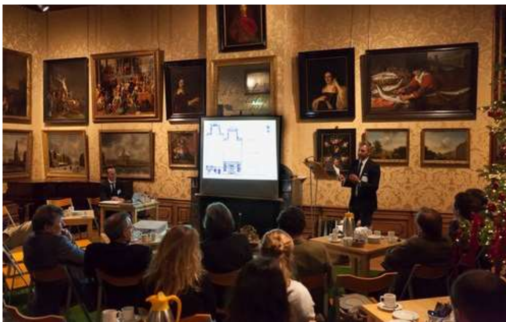
Kick-off bijeenkomst in het Cromhouthuis d.d. 19/12/2016