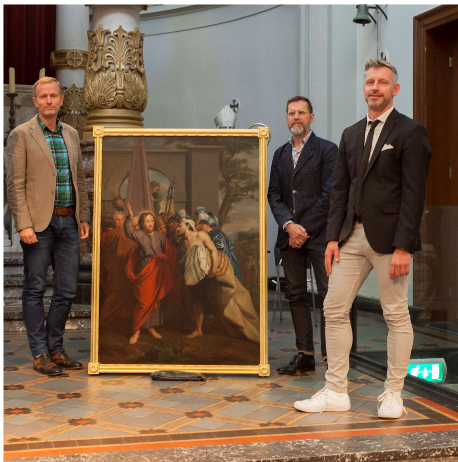
Parollezing 'Op zoek naar de ware Jacob' d.d. 31/08/2017 in het kader van Open Monumentendag